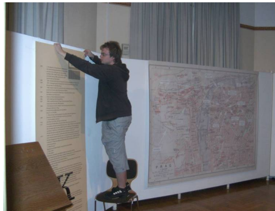
Die Öffentlichkeitsarbeit: Planen und Gestalten von Ausstellungen und Informationsmitteln