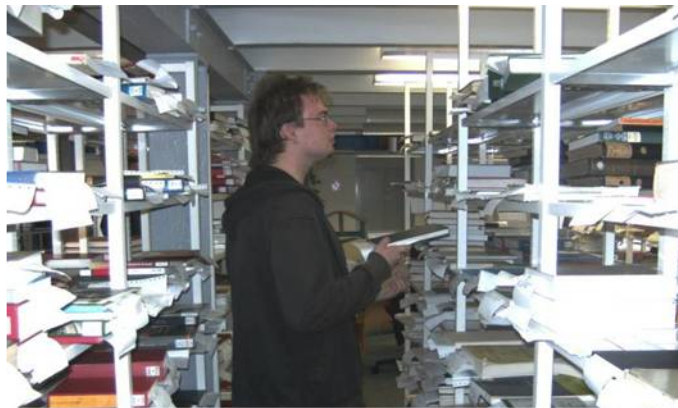
Der Benutzungsbereich: Ausgabe- und Verbuchungsort der Medien

Als besonderes Sammelgebiet beherbergt die Universitätsbibliothek Heidelberg durch ihre historischen Bestände speziell Schriftum über die Kurpfalz und Baden. Über die Deutsche Forschungsgemeinschaft (DFG) betreut sie zusätzlich die Bereiche Mittlere und Neuere Kunstgeschichte (bis 1945), Südasiens, Klassische Archäologie und Ägyptologie.