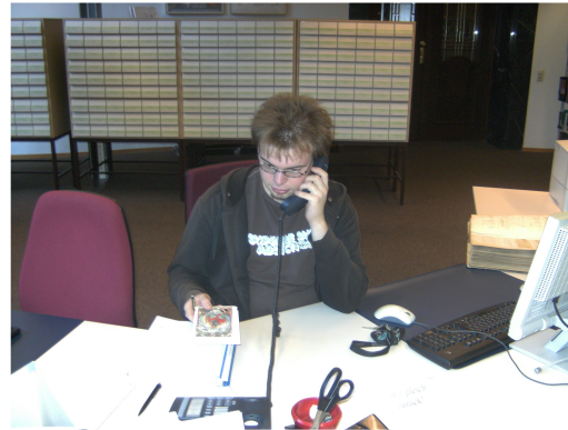
Das Informationszentrum Altstadt: Beantwortung von Benutzeranfragen und Informationsvermittlung